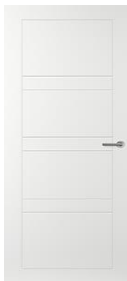
CN 56 Freeslijndeur