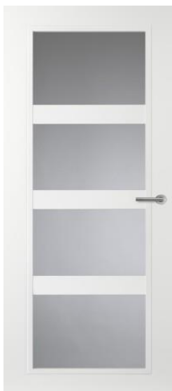
CN08 Glasdeur tussen hal en woonkamer