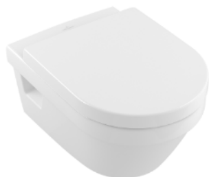
Wandcloset 202.01 en 202.03