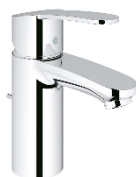
fonteinkraan: xs-size 202.09