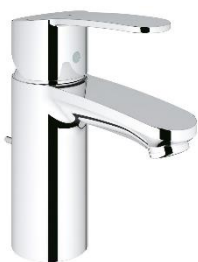
Wastafelkraan: S-size 202.10