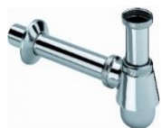
105.40 en 105.41