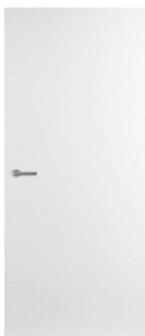
vlakke deur overige deuren