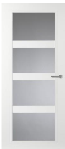
CN08 (helder glas) glasdeur tussen hal en woonkamer