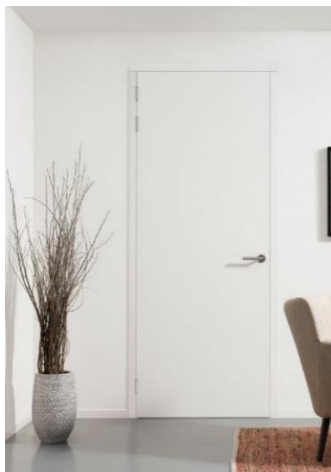
Stompe deur zonder bovenlicht