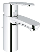
fonteinkraan: xs-size 202.09