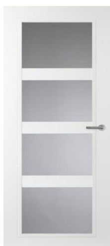
CN08 (helder glas) glasdeur tussen hal en woonkamer