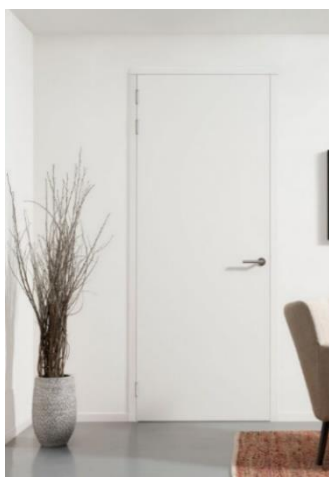
Stompe deur zonder bovenlicht