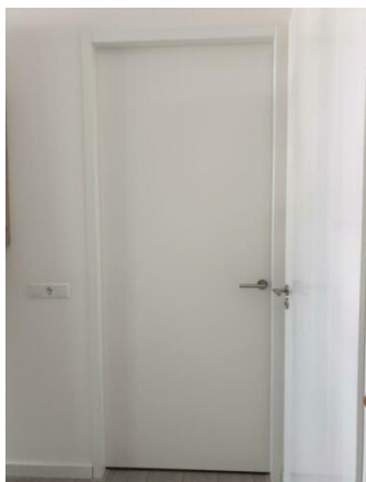
Opdekdeur zonder bovenlicht