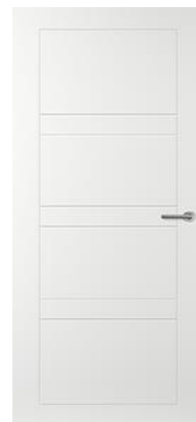
CN 56 freeslijndeur overige deuren