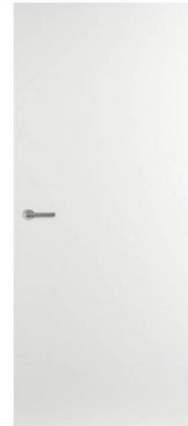
vlakke deur overige deuren