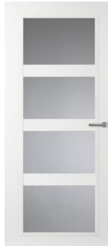
CN08 (helder glas) glasdeur tussen hal en woonkamer